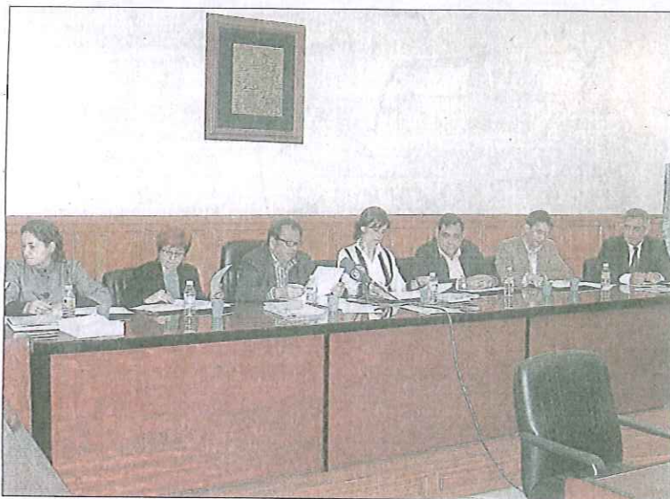
Desarrollo. Acto de constitución del Consejo Territorial de Desarrollo Rural, en el Ayuntamiento de Atarfe. L. O.

Al acto, que se celebró en el salón de plenos del Ayuntamiento de Atarfe, asistieron alcaldes y corporativos de las poblaciones de